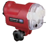
水中撮影用外部 フラッシュ UFL-3 ・耐圧水深75m