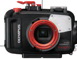
TG-3/4用 防水プロテクター PT-056