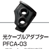
光ケーブルアダプター PFCA-03 ・フラッシュ2灯対応可