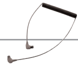
水中光ファイバー ケーブル PTCB-E02