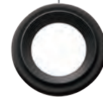
反射防止リング POSR-053 (PT-056に同梱)