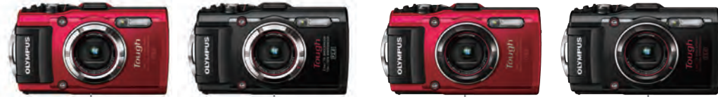
防水コンパクトカメラ STYLUS TG-3 RED