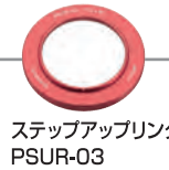
ステップアップリング PSUR-03 ・φ52mm-67mm